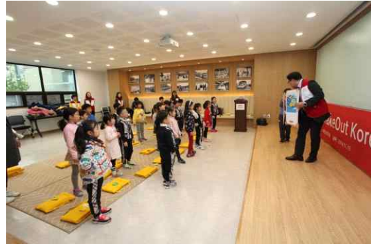
서울 본사 희망브리지홀