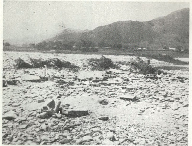
뜨거운 동포애는 모래와 돌만의 폐허위에 이렇게 結晶되어 再起의 원동력이 된다.