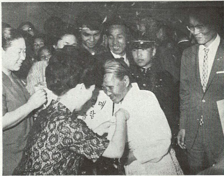
한사람 한사람의 조그마한 정성이 모여 거리의 불행을 조금이라도 도움고자 한다.