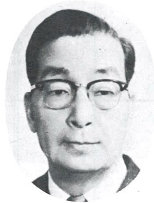
4 대 회 장 林 炳 稷 초대 외무부장관