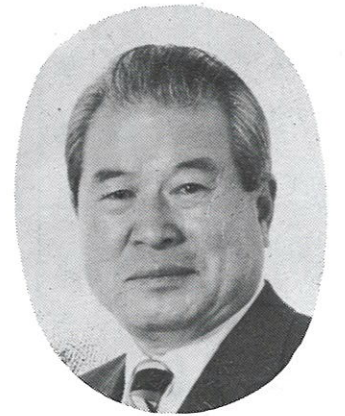
7 대 회 장 柳 建 浩 (前) 朝鮮日報社 代表理事