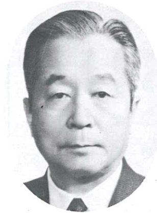
초 대 회 장 兪 鎮 午 (前) 再建國民運動中央會 會長