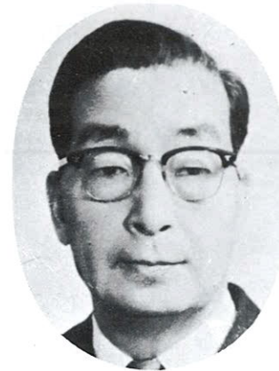
4 대 회 장 林 炳 稷 초대 의무부장관