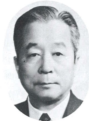
초 대 회 장 兪 鎮 午 (前) 再建國民運動中央會 會長