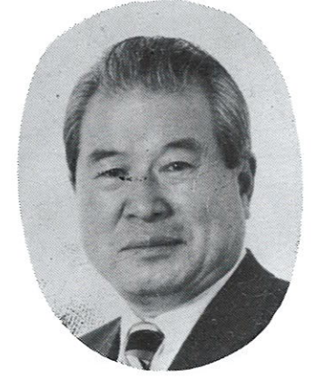
7 대 회 장 柳 建 浩 (前) 朝鮮日報社 代表理事