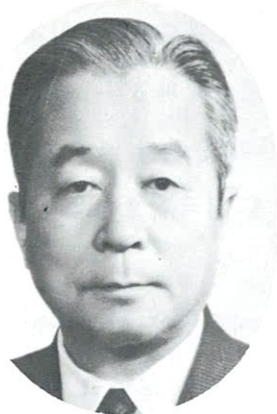
초 대 회 장 俞 鎭 午 (前) 再建國民運動中央會 會長