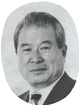
7 대 회 장 柳 建 浩 (前) 朝鮮日報社 代表理事