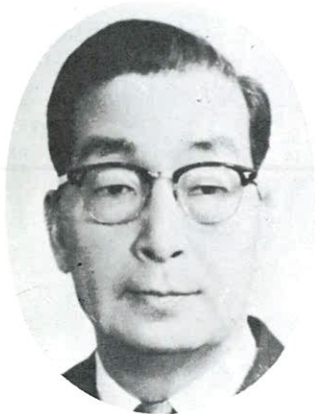
4 대 회 장 林 炳 稷 초대 의무부장관